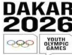
Comité d'Organisation des Jeux Olympiques de la Jeunesse 2026