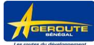
Agence des Travaux et de Gestion des Routes du Sénégal