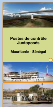
Postes de contrôle Juxtaposés Mauritanie - Sénégal